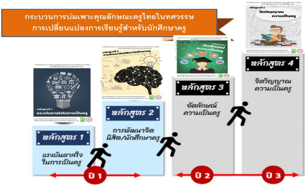
ภาพประกอบ 2 กระบวนการบ่มเพาะคุณลักษณะครูไทยในทศวรรษการเปลี่ยนแปลงการเรียนรู้ สำหรับนักศึกษาครู